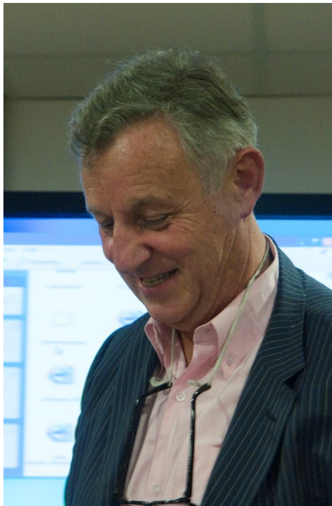
Pr Georges Offenstadt 03/09/1944-09/04/2109